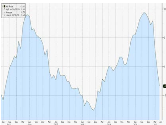
Impulso del crédito en China.